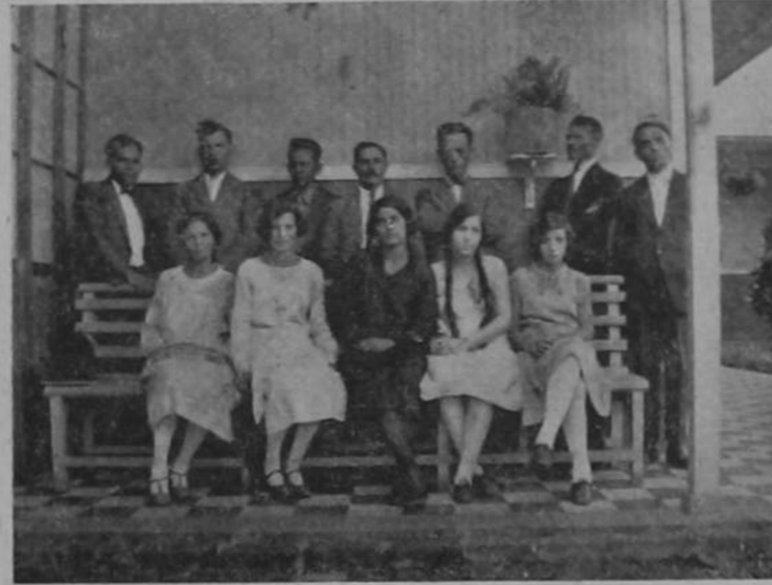
De Pie: De izquierda a derecha:

El día designado para la celebración de la Fiesta del Arbol